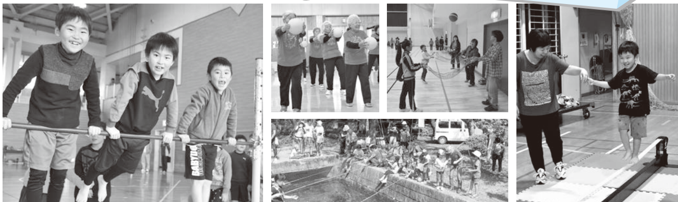
地域スポーツクラブ一覧