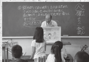
▲小学校での人権講話

私たち人権擁護委員（※）は、小学校や中学校で「人権講話」や「人権の花運動」を行っています。いじめなどをテーマにしたDVDを活用し、思いやりの大切さなどを考えてもらったり、子どもたちが協力しながら花を育てることなどを通して、命の大切さを伝えていきます。皆さんの命は、先祖代々からつながっているとでも尊いものです。