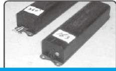
業務用・施設用蛍光灯の安定器