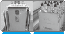
高圧変圧器 高圧コンデンサー