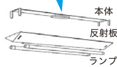
本体 反射板 ランプ