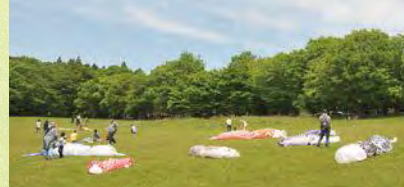
うつのみや文化の森(長岡町)

宇都宮美術館に隣接した緑豊かな26haの丘陵地の公園。体験型学習や自然観察会なども開かれています。