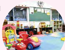
青少年活動センター ／あそぼの家

役立つ講座の他、隣接する「あそぼの家」で元気いっぱい遊べます。 ☎青少年活動センター ☎(663)3155