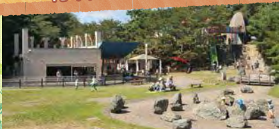
八幡山公園(靖田5丁目)

大型の遊具施設やゴーカートなど、言わずと知れた宮っこの遊び場。春には桜の名所となります。