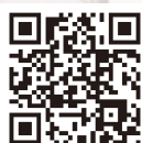
▲「わく・わくショップU」ホームページ