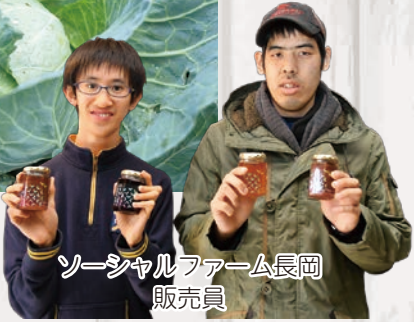
ソーシャルファーム長岡 販売員

▲火曜日出店「ソーシャルファーム長岡」の新鮮野菜。低農薬、露地栽培で季節の旬の野菜が魅力。また養蜂も営み、蜂蜜も人気です。