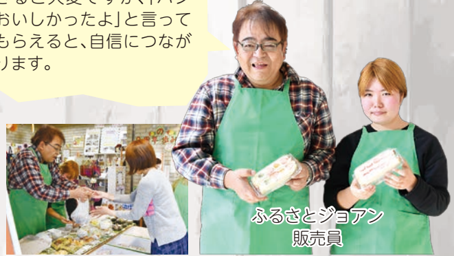
ふるさとジョアン 販売員

新鮮な素材にこだわって作っています。行列ができるで大変ですが、「パンおいしかったよ」と言ってもらえると、自信につながります。