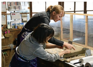
▲宮染め(中川染工場) 平成29年5月26日放送分

2000年から日本に在住。現在は 技術翻訳や教会通訳、英会話教師な どの業務に携わる。