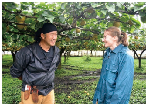
▶梨(山口果樹園) 平成29年9月22日放送分

足を運べば、見て、食べて、学べるものがたくさんありました。 読んでいる皆さんにメッセージはありますか。 私たちが出演した「教えてイトコ UTSUNOMIYA」を通して、宇都宮の皆さんにも、自分たちの街にこんな素敵なものがあることを改めて知ってもらえたらうれしいです。 私自身、もっといろいろな体験をして、ますます宇都宮の魅力を発見していきたいです。