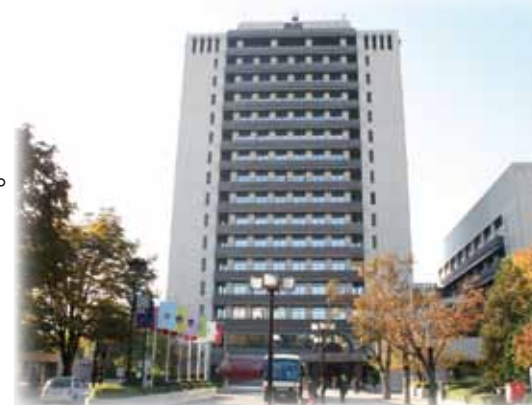
宇都宮市役所本庁