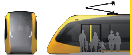
芳賀・宇都宮LRT車両