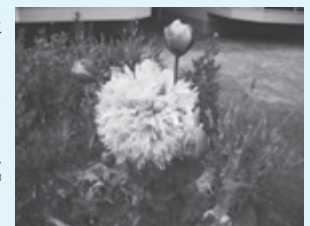
▲植えてはいけないケシの花・蕾

近年では、大麻の危険性を軽視する人が増えていますが、大麻は、脳に影響を与える違法薬物です。酩酊感、陶酔感、幻覚作用などをもたらし、依存性があります。特に未成年の乱用は、心身の発達に大きな影響を与えることが明らかとなっています。間違った情報に流されず、正しい知識で判断しましょう。