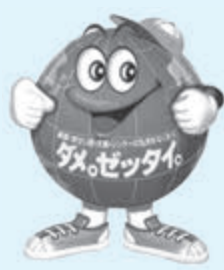
▲ダメ。ゼツタイ。くん

麻薬や覚醒剤などの薬物を乱用することは、使用者自身の精神や身体をぼろぼろにし、幻覚、妄想などにより、殺人などの重大な犯罪を引き起こす原因にもなります。