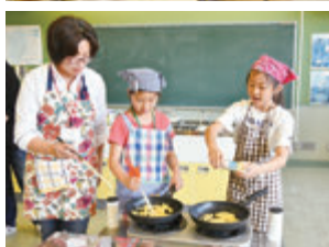
▲ジャガイモで料理

「私に、放課後子ども教室が子どもたちの楽しく学べる場であってほしい」と思っています。今後は、子どもたちにより楽しんでもらえるよう、新しいイベントも積極的に取り入れていこうと考えています。そのためにも、さらに多くの皆さんに協力していただきたいです。 皆さんも、子どもと楽しみながら地域教育に取り組んでみませんか。そして、子どもも大人もみんな楽しく活動し、地域の輪を広げていきましょう。