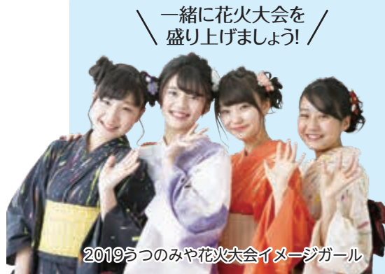
2019うつのみや花火大会イメージガール