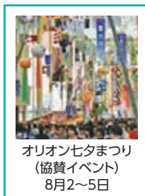
オリオン七夕まつり (協賛イベント) 8月2～5日