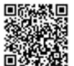
▲実行委員会 HP URL1

国体に向けて、ボランティア募集や花いっぱい・クリーンアップ活動、競技会観戦など、市民の皆さんにご参加いただくさまざまな活動を展開していく予定です。詳しくは、いちご一会とちぎ国体・とちぎ大会宇都宮市実行委員会 HP URL1 をご覧ください。