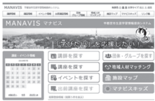
▲MANAVIS HP トップ画面

net@gmail.com。問 市民芸術祭ミュージカル部会 ☎(645) 6449 図書館利用が 5年間ない人の登録情報を 削除します 個人情報保護のため、平成26年9月1日から5年間、図書館・図書室で一度も資料を借りていない人の登録情報を、9月17日に削除します。 削除後に改めて登録する場合は、氏名・住所を証明できるものをお持ちの上、直接、各図書館へ。 問 中央図書館 ☎(636) 0231