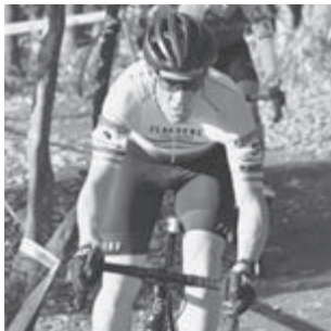
クリス・ジョンジェワード 選手 (オーストラリア)