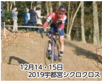
12月14・15日 2019宇都宮シクロクロス