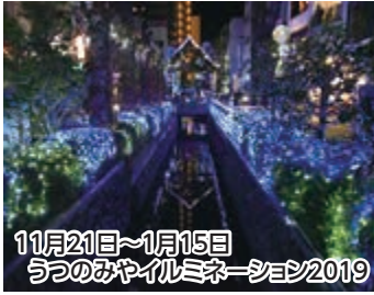
11月21日~1月15日 うつのみやイルミネーション2019