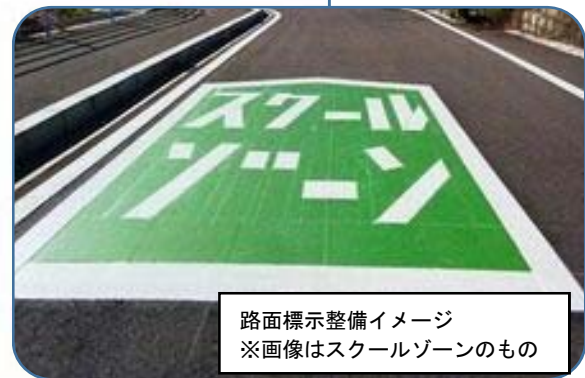
路面標示整備イメージ ※画像はスクールゾーンのもの

●キッズゾーンの設定（令和2年4月1日） ・施設の周囲500メートルをキッズゾーンとして設定する。