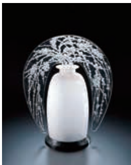
ルネ・ラリック 大型常夜灯「エニシダの花と枝」1920年 北澤美術館蔵

■企画展「北澤美術館所蔵 ルネ・ラリック アール・デコのガラス モダン・エレガンスの美」