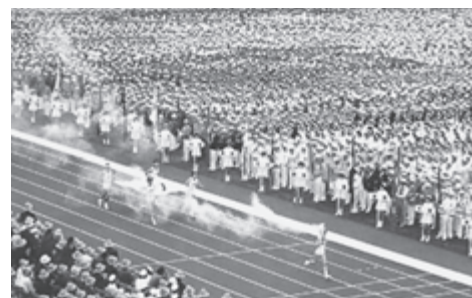
▲栃の葉国体の炬火リレー