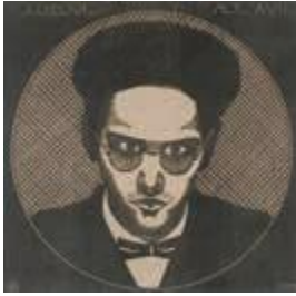
サミュエル・イエスルン・デ・メスキータ「ヤープ・イエスルン・デ・メスキータの肖像」1922年 個人蔵

▼期間 8月30日まで ▼費用 一般1,000円、高校・大学生800円、小・中学生600円(観覧料) ▼その他 同時開