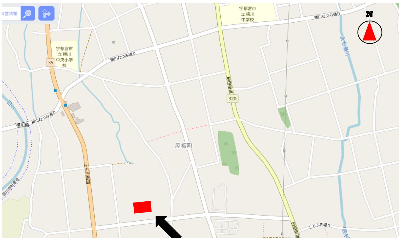
老人福祉センターことぶき会館