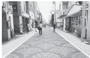
▲完成した一部を掲載

ID 1025084 独自性のある都市景観に ユニオン通りが リニューアルされます