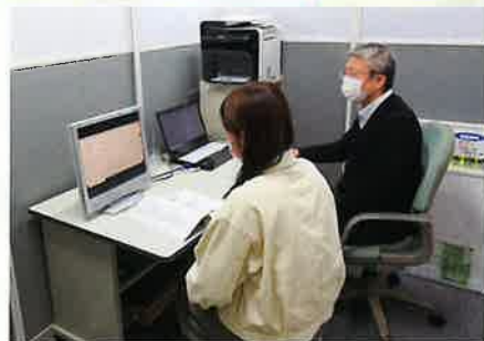
(知財総合支援窓口)