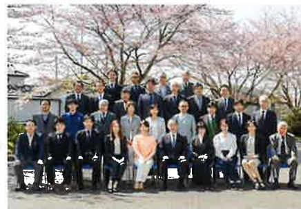
(よろず支援拠点コーディネーター)

⇒ 栃木県よろず支援拠点 TEL 028-670-2618 ⇒ 総合相談グループ TEL 028-670-2607