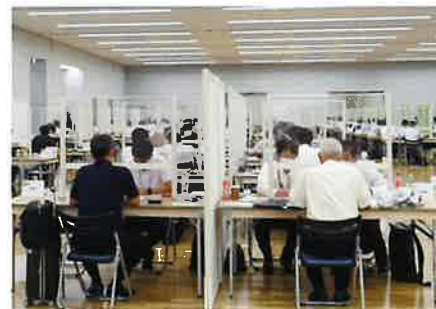
(ビジネスマッチング商談会)