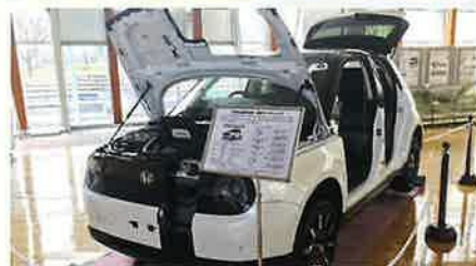
(解析ワークショップ カットモデル)