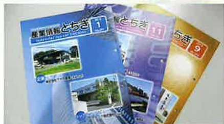
(情報誌「産業情報とちぎ」)