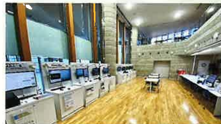
(とちぎビジネスAIセンター)