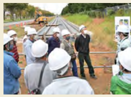
▲工事の説明に興味津々

この機会にしか見られない工事現場での出前講座を受け付けています。興味のある団体(自治会やサークル)は、協働広報室へ。