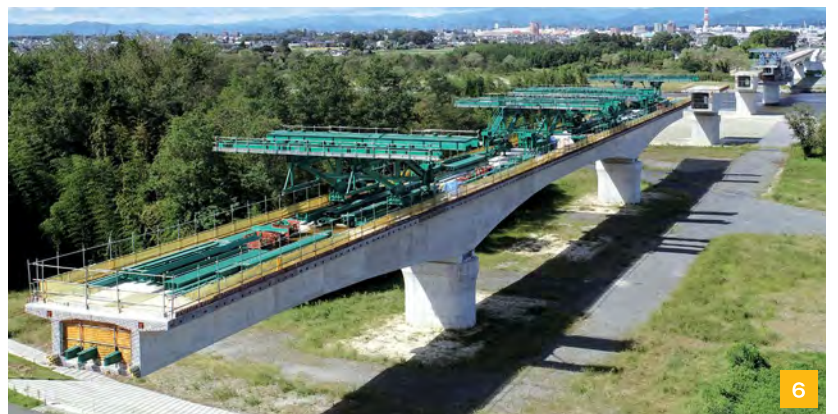
1 停留場イメージ。2 [(仮称)清原工業団地北停留場]工事中。3 清原工業団地内でのレール設置の様子。4 LRT車両胴体側面。5 LRT車両先頭部。車両の顔を整えます。6 鬼怒川橋りょう左岸。