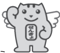
▲明るい選挙キャラクター 選挙のめいすいくん