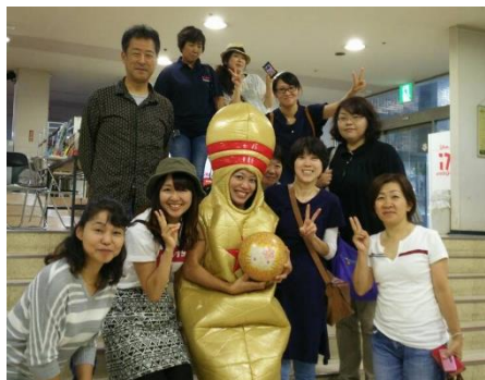
平成 30 年 9 月社内レクリエーション

株式会社玄米酵素が行っている「食アドバイザー」資格の勉強やセミナーへの参加など、社員の食の意識を高める機会が多く、家族、友人、お客様への提案も出来るようになりました。また、玄米菜食、発酵食品、植物性タンパク質などを摂ることを心掛けることにより、自己免疫力が向上し病気をしない身体になりました。