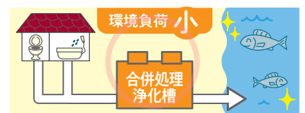
し尿のほか、台所や風呂などで使われた生活雑排水をきれいにして河川などに放流