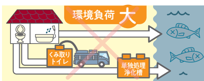
台所や風呂などで使われた生活雑排水が処理されずそのまま放流