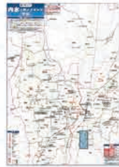
内水ハザードマップの作成

内水ハザードマップは局HPで公表しているほか、下水道管理課及び地区市民・市民活動センターの窓口で配布しています。