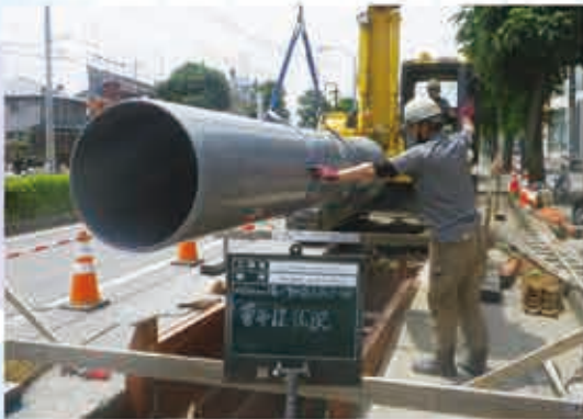
雨水管きよ整備の工事

まちなかでの浸水を防止・軽減するために、雨水を川に流す雨水管きよの整備工事を進めています。