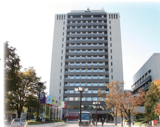
宇都宮市役所本庁舎