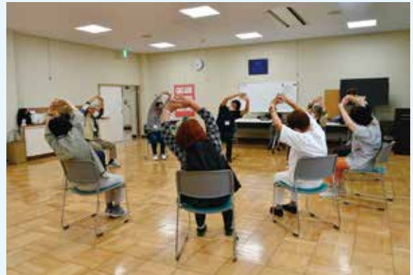
はつらつ教室(介護予防教室)

会場 地区市民センター、地域コミュニティセンター、公民館などで行います。(詳細は、お近くの地域包括支援センターまでお問い合わせください。)