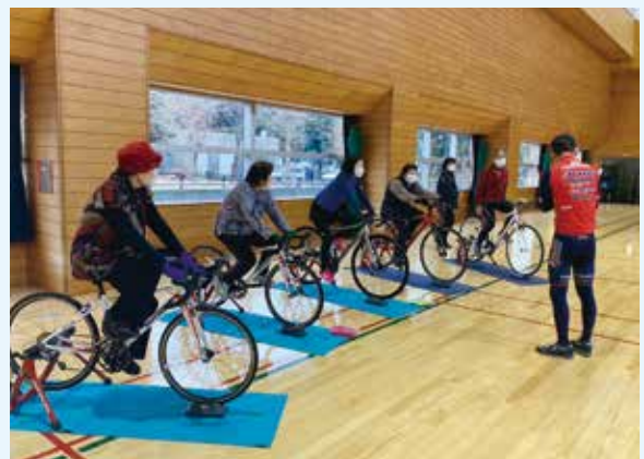
いきいき健康自転車教室