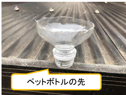
ペットボトルの先

雨どいの集水部に落ち葉が入らないようにペットボトルを使用し工夫をしたところ浸透マスの中には、ほとんど落ち葉が流れ込まなくなりました。