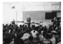
▲平和語り継ぎ講演会

戦争体験者が市内の小中学校で、宇都宮空襲や原爆被害の実態、戦争の悲惨さや平和の大切さについて講演した動画を、市 URL で公開しています。ぜひご覧ください。