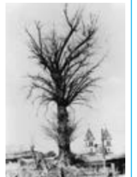
▲戦火を生き抜いた旭町の大きいちょう

本市は当時、「軍都」と呼ばれるほど、飛行場やさまざまな軍需工場が多くあり、それらは敵国の攻撃目標にもなっていました。そのため、7月12日以外にも、戦闘機から機関銃で地上を狙い撃つ「機銃掃射」を受けるなど、本市に多くの被害をもたらしました。