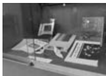
▲平和資料コーナー

▼ 内容 「平和ってなに？戦争を知って平和を考えよう」と題した、平和関連資料の展示、平和資料ブックリストの配布。