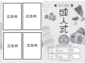
▲成人式用プログラムイメージ