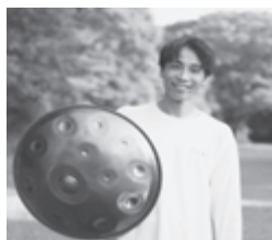
▲ハンドパンの生演奏

▼定員 抽選 300人。 ▼費用 500円(参加費)。 ▼申込期限 7月15日。