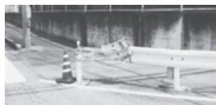
▲壊れたガードレール

市民通報システム「宮ココ」 ID 1026639 スマートフォンなどの写真・位置情報機能を使っ て、道路(市道)の損傷など、市の施設の不具合に ついて、市民が簡単に確実に通報できるシ ステムです。詳しくは、市 ☎をご覧ください。 問 道路保全課 ☎(632)2512