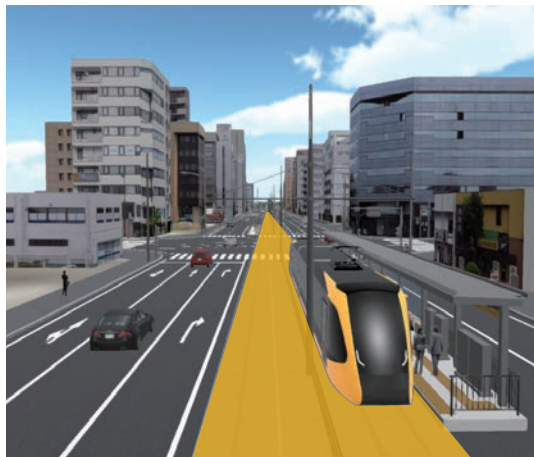
▲道路中央の色が掛かっている部分に、LRTが走るためのレールを敷いていきます。

工事情報は、案内看板やホームページなどを通して随時お知らせしていきます。工事期間中は、作業内容により走行できる通行帯が変わるなど、交通規制を伴いますので、現場の誘導に従ってください。ご理解ご協力をお願いします。