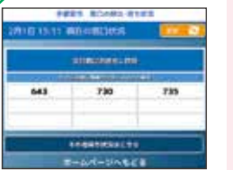
▲待ち状況配信の例