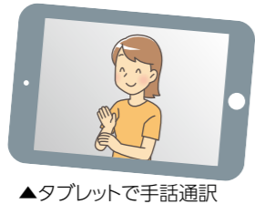
▲タブレットで手話通訳