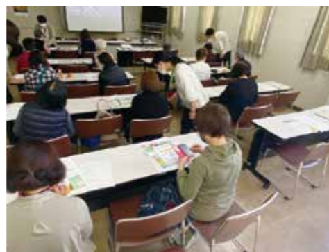
▲スマートフォン教室