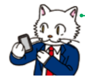
▲徴収担当 ニャンニャン係長