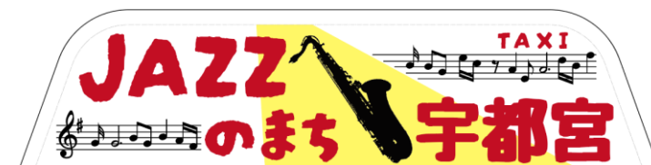
タクシー車両上部に設置する表示灯のイメージ