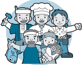
事業所得、不動産所得などの所得がある人

事業所得、不動産所得などの所得がある人は、市から送付する納付書または口座振替などで納めてください。