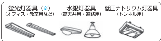
▲日本照明工業会HPより

※蛍光灯器具は、磁気式安定器が対象です。インバータ(電子)式安定器には、PCBは使用されていません。