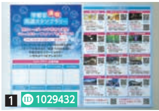
1 ID 1029432