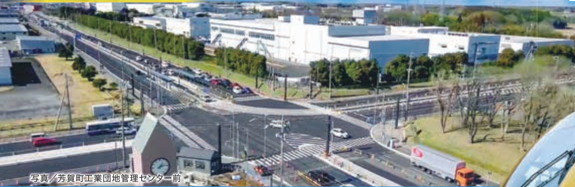
写真/芳賀町工業団地管理センター前

今年8月の開業に向けて、4月27日(木)よりグリーンスタジアム前～芳賀・高根沢工業団地間においても試運転を実施しています。また、今月からは全線で習熟運転を実施する予定です。習熟運転とは、車両と軌道施設の安全性を確認する試運転に対し、輸送の安全性の確保に向けて運転士等が訓練を行うものです。