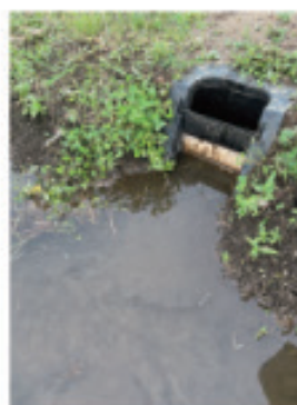
排水調整マスを設置した田んぼ