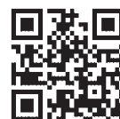
▲うつのみや イルミネーションHP