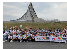
東京レインボープライド2024の様子