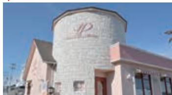
4 アトリエ ドウ メテオール