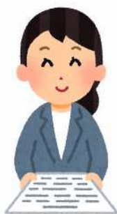
調査票の配布・回収