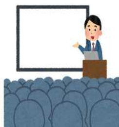
説明会への出席 調査用品の受領