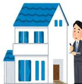
担当調査区の範囲と 調査対象の確認、地図の作成