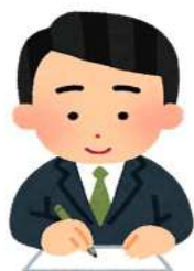
集めた調査票の 検査・整理