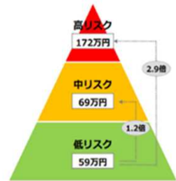
1人あたりの 労働生産性損失コスト

(出所)横浜市の労働生産性損失は年間 76.6 万円(従業員一人当たり)！健康リスクと労働生産性損失の関係が明らかに！(平成 30 年 6 月)を基に経済産業省が作成