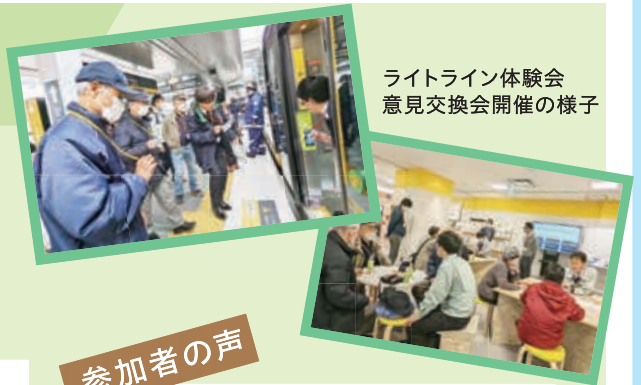
ライトライン体験会 意見交換会開催の様子

ライトラインの実車を活用した事業説明・現場見学・これからのまちづくりについて考える意見交換会を実施しています。皆さんも一緒に宇都宮のまちづくりを考えませんか?