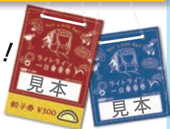
※乗車券のデザインはイメージです