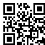
つうえんポータル

右記の二次元コードを読み込み、つうえんポータルにアクセスし、その画面にてお住まいの自治体を選択し、利用申請をしてください。