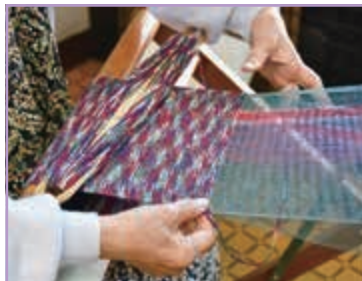
心をこめて みやこ