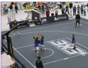
今年も行きます バスケ