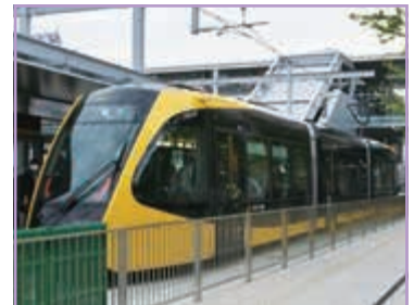
やっと見れたライトライン！ エルミヤ