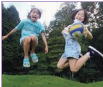
宮っ子 ジャンプ JUMP! ちなかり